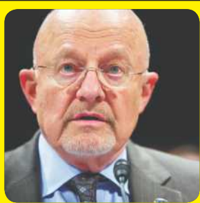
LEA MÁS... PÁG 2-C James Clapper.

WASHINGTON, DC, 21 Dic (Notimex).- Estados Unidos realizó actividades de espionaje y monitoreo de comunicaciones electrónicas contra objetivos en el exterior autorizadas por el presidente George W. Bush