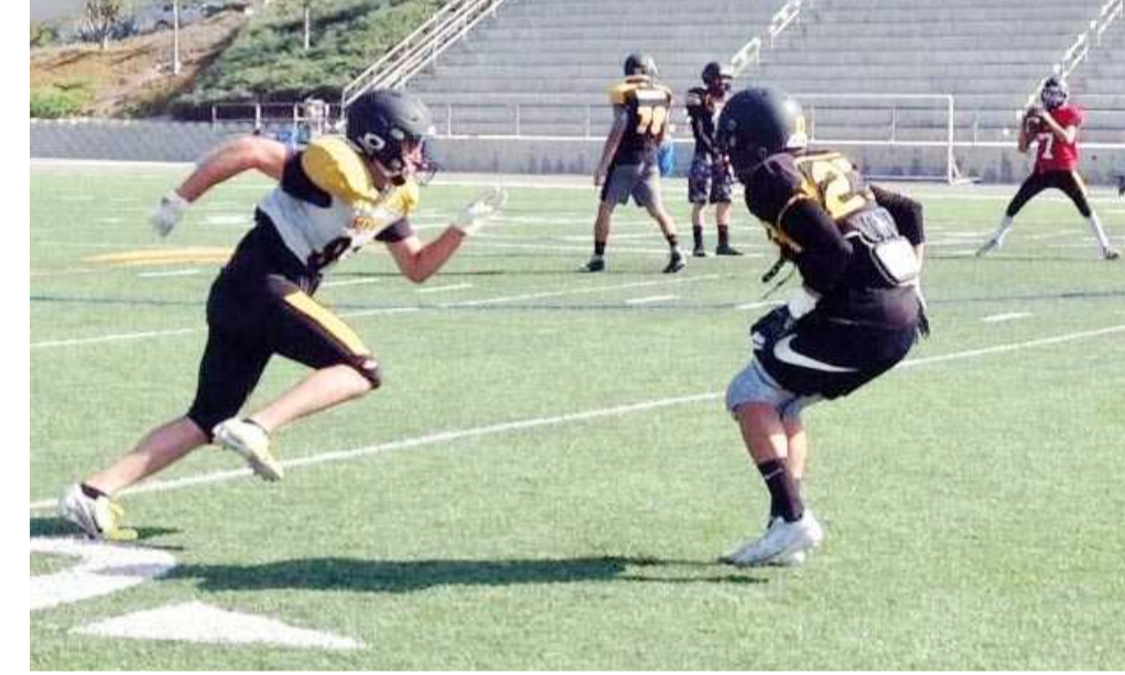
Terminó el primer receso de la temporada y los Zorros del Cetys Tijuana se ponen a tono para el siguiente partido en la Conferencia Premier de Fútbol Americano CONADEIP, siendo Borregos Tec Campus Querétaro el rival.

"Teóricamente, estamos arrancando otra vez la campaña regular. Mayormente, cualquier entrenador que cuenta con menos de 40 elementos tiene mucho por ganar y poco por perder.