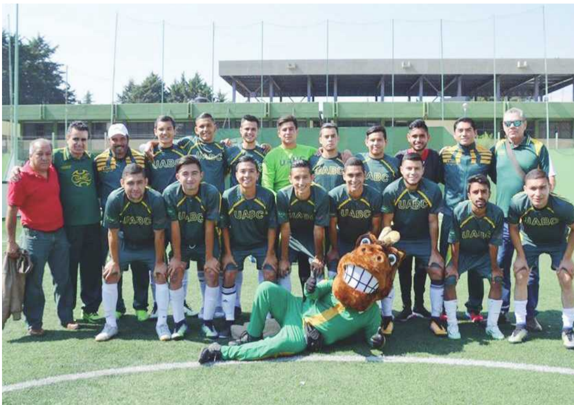
Una vez más la Universidad Autónoma de Baja California será sede de la Universiada Regional, pero en esta ocasión será por primera vez el campus Tijuana quien reciba a los deportistas universitarios de la región.

Mientras que la segunda parte se llevará a cabo en Cety Mexicali campus Mexicali, con las disciplinas de Atletismo, Baloncesto, Beisbol, Karate Do, Rugby, Tae Kwon Do, Tiro con Arco, Tochito, Triatlón