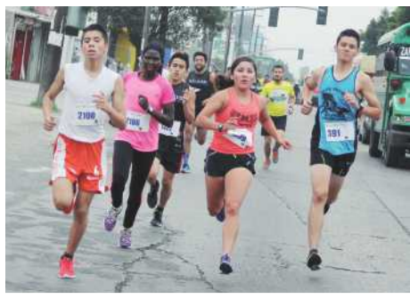
El estadio Gasmart será una vez más el epicentro del deporte tijuanaense, al sonar el balazo de salida para la primera edición de la Carrera Atlética Chevron-Toros de Tijuana.

En los deportes que se realizarán en UABC sede será UABC los Cimarros clasificarán directamente sin necesidad de competir en los Juegos Estatales Universitarios contra otras instituciones, pero en el resto de las disciplinas sí deberán ganar el pase a la etapa regional, y el mismo caso aplica para Cety.