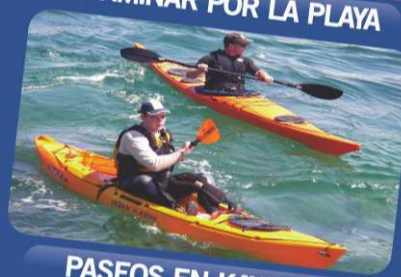
PASEOS EN KAYAK