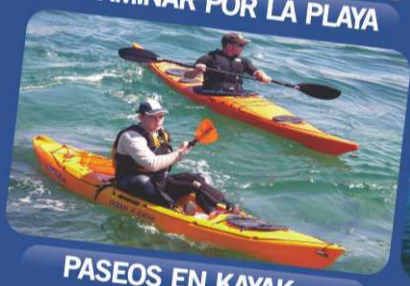
PASEOS EN KAYAK