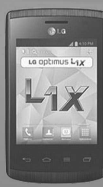
LG E410 Optimus L1X