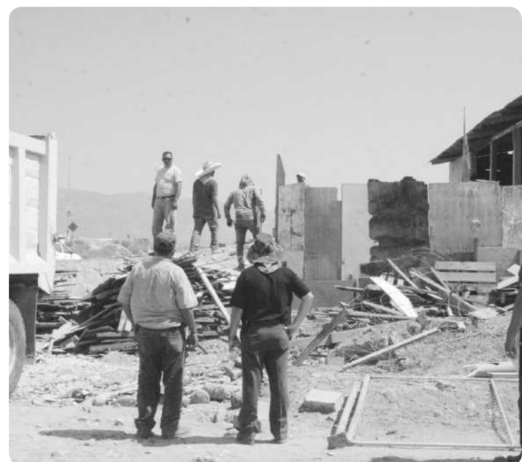
TIJUANA.- Así lucían antes de ser destruidos por el OCPBC, los cuartos construidos a orillas del Arroyo Alamar, en donde ahora se construyen unas Vías Rápidas que conectarán al bulevar 2000, una vez concluidas las obras.

madamente" varios particulares, de quienes se desconoce si pertenecen a alguna organización social.