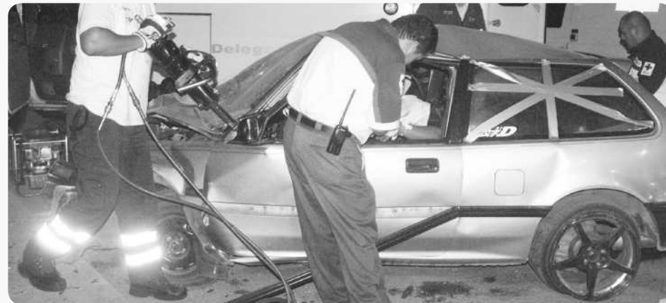
TIJUANA.- De acuerdo a cifras de la Secretaría de Salud del Estado la aplicación de programa tales como el alcoholímetro han disminuido en un 44% los accidentes y muertes relacionados con el consumo del alcohol.

Aunado a estas acciones siguen los programas preventivos tales como Hoy Conduzco Seguro y Sexo Seguro. (hom)