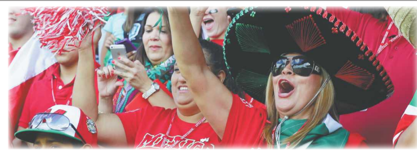
Imponente lució la porra tijuanaense al arrancar el Mundial de Ligas Pequeñas 2013.