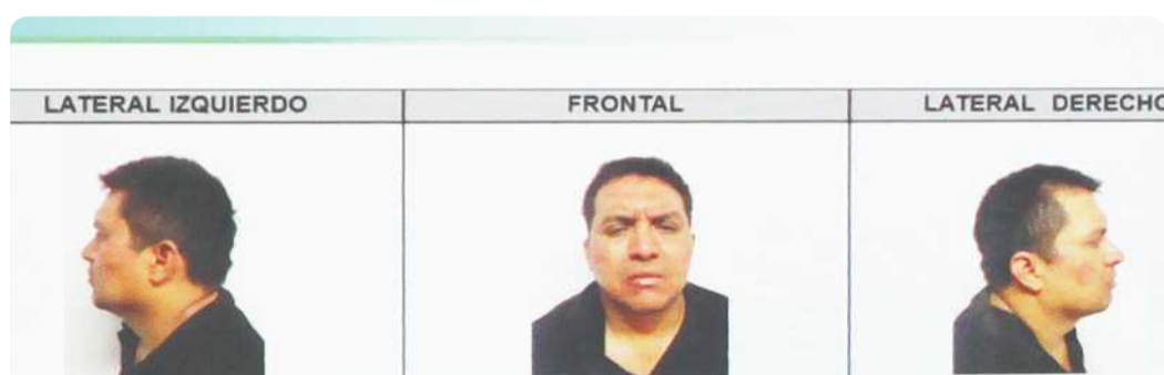
Miguel Ángel Treviño Morales, 40 años Probable Responsable de hechos ilícitos

Aproximadamente a las 3:00 horas un helicóptero de la Armada interceptó una camioneta pick up en la cual viajaba Treviño Mo-