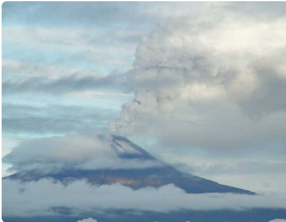
Entre las 07:30 y 07:44, de este sábado, el volcán Popocatepetl emitió una columna de ceniza que pudo ser captada a varios kilómetros a la redonda.

El volcán se ubica a 65 kilómetros (40 millas) del aeropuerto y éste se encuentra unos cuantos kilómetros al este del centro de la ciudad.