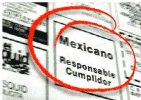
El Mexicano desde 1959 ha tenido la responsabilidad de mantener informada a la región de manera veraz y oportuna.

Mutlu dijo que la protesta no tenía autorización y advirtió que la policía intervendría. Agregó que las autoridades planean reabrir el parque el domingo o el lunes.