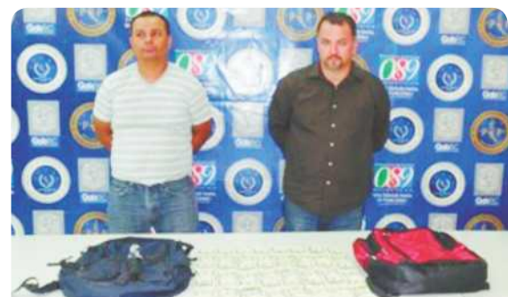
Agentes de la PEP rechazaron la suma de 240 mil dólares en efectivo por dejar en libertad a dos individuos que portaban esa cantidad de dinero.

SOBRE INSURGENTES fue apresado este individuo con 17 mil dólares.