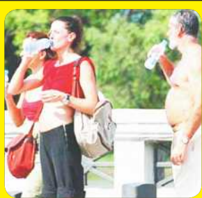
Subirán las temperaturas en Reynosa.

REYNOSA, TAMPS., 7 Jun. (Notimex).- El sector salud alertó a la población a extremar precauciones para evitar casos de deshidratación o golpe de calor, debido a que la temperatura en esta frontera oscila entre 38 y 40 grados centígrados.