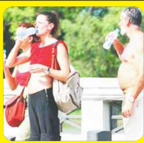
Subirán las temperaturas en Reynosa.

REYNOSA, TAMPS., 7 Jun. (Notimex).- El sector salud alertó a la población a extremar precauciones para evitar casos de deshidratación o golpe de calor, debido a que la temperatura en esta frontera oscila entre 38 y 40 grados centígrados.