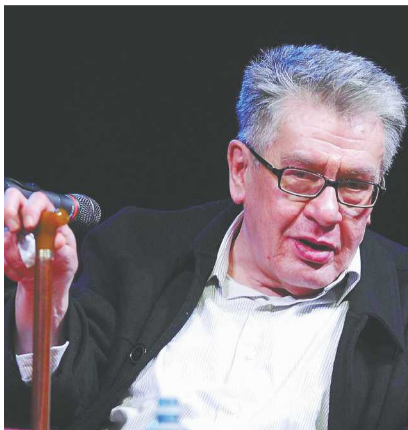
En su narrativa José Emilio Pacheco retrató desde una perspectiva crítica el México que conoció en su infancia y en su adolescencia, en la década de 1950.

"Los elementos de la noche", fue publicado en 1963. En los versos minimalistas del ganador del Premio Reina Sofía de Poesía Iberoamericana (2009), reunidos en más de 20 títulos, el mosaico de protagonistas incluye elementos como los mosquitos, el circo, una piedra, el mar y la nieve. "La gota es un modelo de concisión: todo el universo encerrado en una gota de agua", mencionó José Emilio Pacheco en uno de tantos poemas donde examinó a la naturaleza, a lo cotidiano, al tiempo y a la poesía misma.