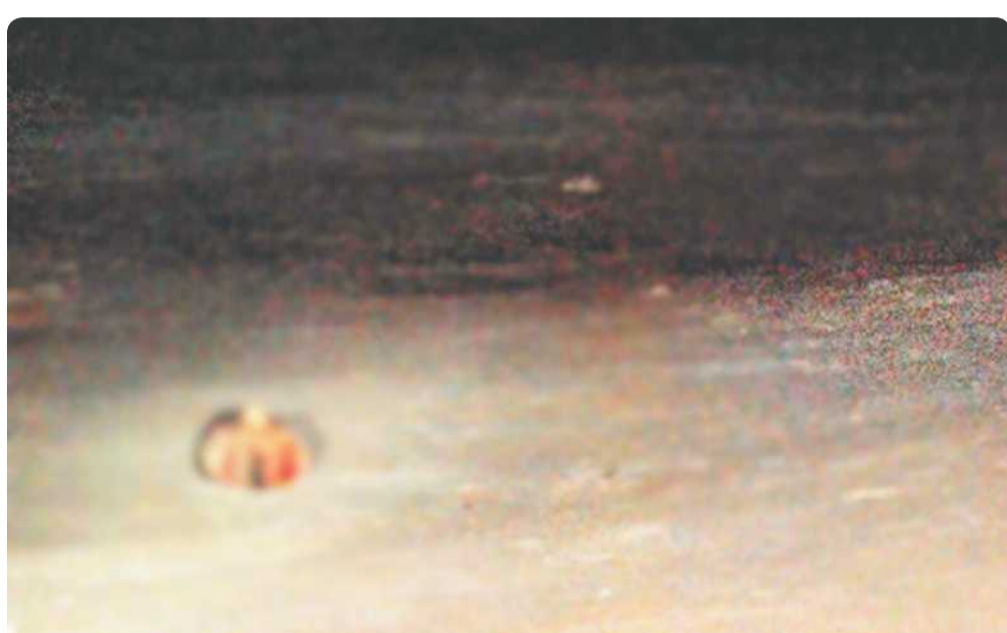
MEXICALI.- La cabeza de un sujeto que fue identificado como narcomenudista de poblado Delta, fue hallada tirada en un lote baldío del poblado del ejido Oaxaca. El resto del cuerpo no era hallado hasta ayer tarde.

Fue alrededor de las 23:00 horas cuando vecinos del lugar reportaron a la Central de C4 que había sido arrojada una cabeza humana a un lote baldío ubicado frente a la iglesia de "Nuestra Señora de Fátima" ubicada en la avenida Ocampo de la citada comunidad localizada a un costado del poblado Delta, de donde era residente.