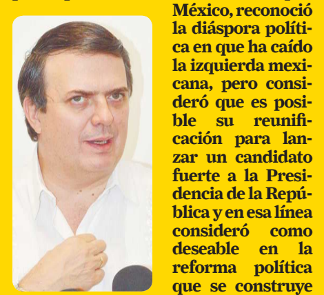
Marcelo Ebrard Casaubón.

El ex jefe de gobierno del Distrito Federal calificó como un error táctico la participación del PRD en el Pacto por