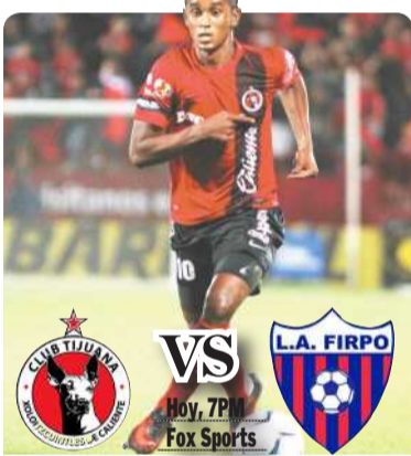
VS L.A. FIRPO Hoy, 7PM Fox Sports

Hoy visita al Firpo, en el Estadio Sergio Torres, en Usulután, El Salvador