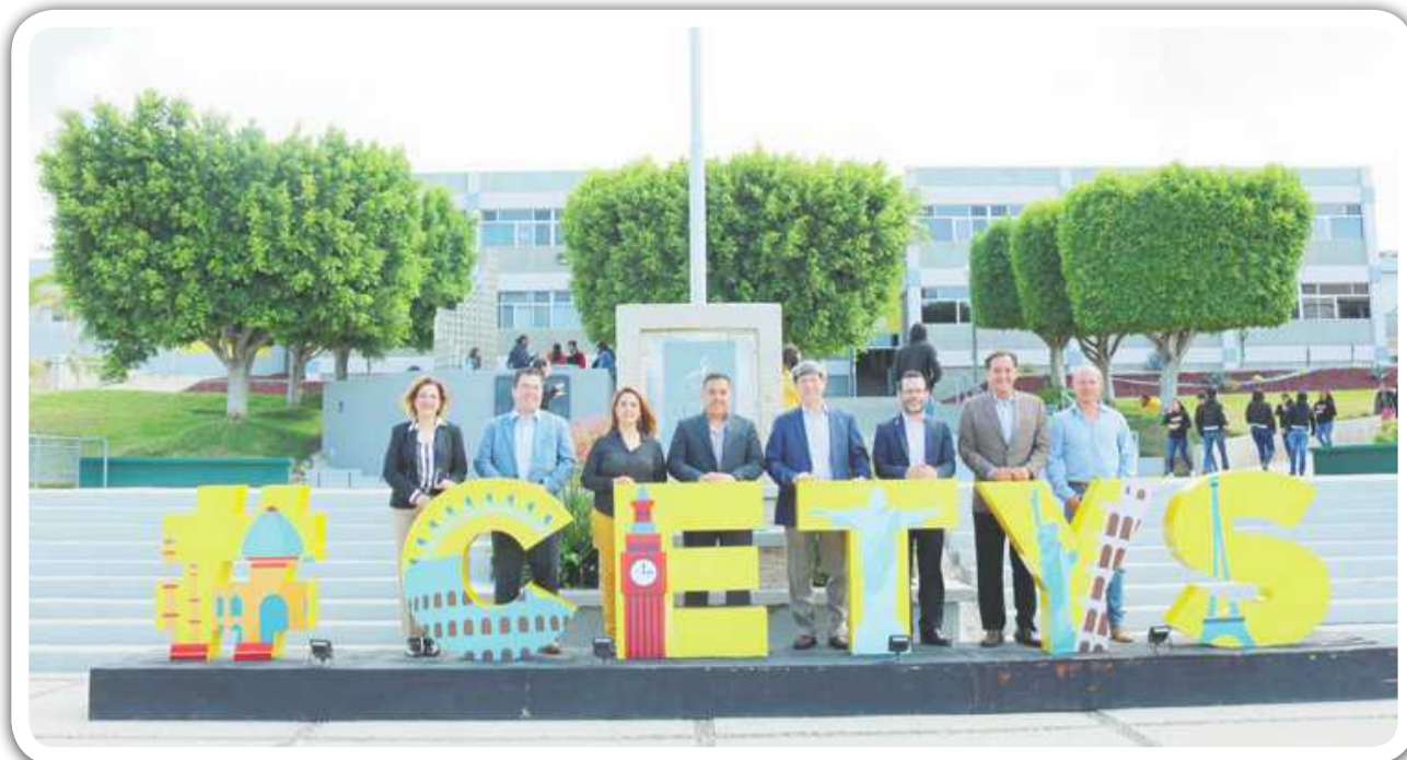
Directivos de CETYS sostuvieron encuentro con el astronauta mexicano José Hernández.