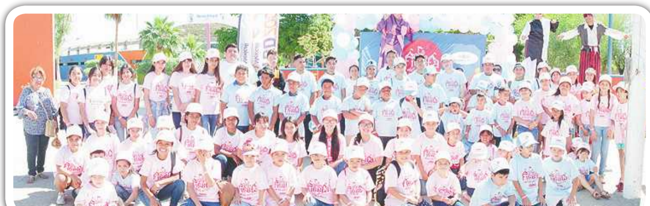
Grupo de chiquitines que disfrutaron la celebración del Día del Niño que organizó Cadenas de Ayuda para México.

Después del espectáculo los menores pasaron a la cancha de softball donde pudieron disfrutar de tacos, quesadillas, sodas, dulces, pastel, pizzas, churros, entre otros, así como también tuvieron acceso a diferentes estaciones recreativas como las brincolinas, toro mecanico, ponys, salón de belleza y pinta caritas así como el área de “ven a pintar”.