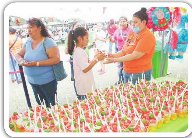
Aspecto del desarrollo del festejo del Día del Niño de la organización Cadenas de Ayuda para México.

MEXICALI. Un día de alegría y diversión fue lo que se vivió este domingo 28 de abril en el evento denominado La Gran Fiesta del Día del Niño, evento que llevó a cabo Cadenas de Ayuda para México para ofrecerles a niñas, niños y jóvenes de casas hogar, instituciones y comunidades en situación vulnerable un día de esparcimiento, convivencia y sana diversión.