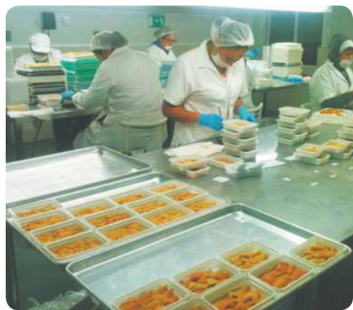
La empresa se dedica a empacar erizo en su planta de alta calidad.

Dijo desconocer porqué los han querido involucrar con la detención de esta persona con erizo, ya que en primera ellos exportan puro erizo rojo y la persona detenido llevaba erizo morado, el cual tiene un precio mucho más barato y es poco aceptado en otros continentes; la certificación que tenemos, la documentación ampara los arribos del producto,