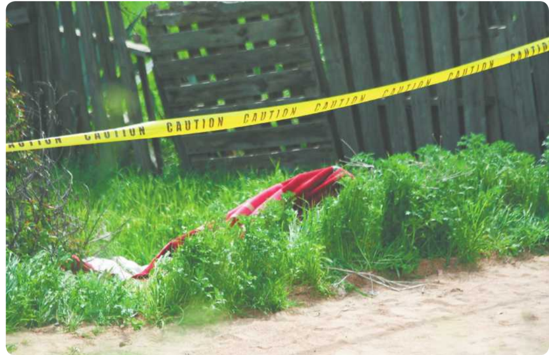
Al parecer el occiso presentaba una herida provocada con arma blanca.