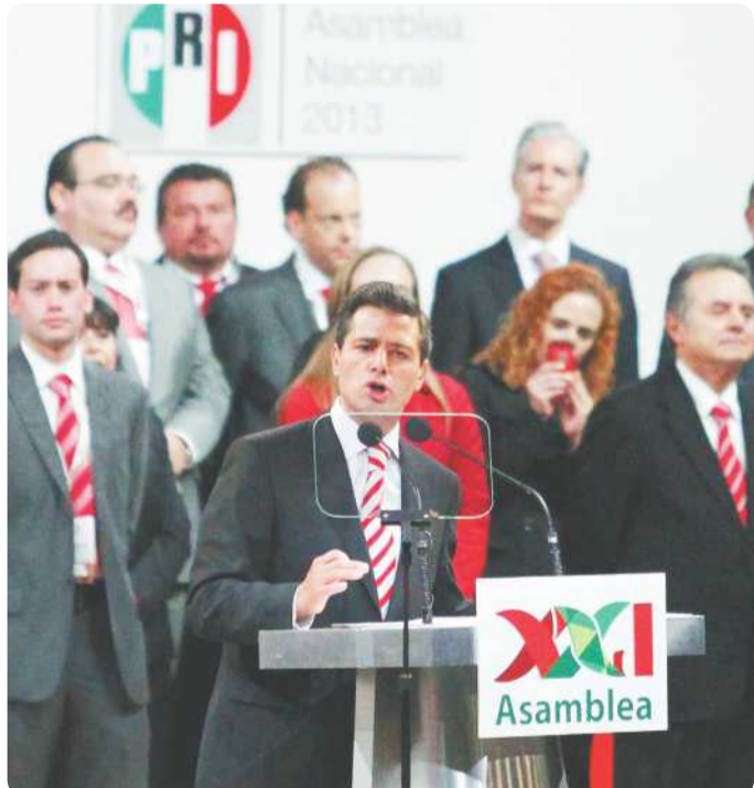
MÉXICO.- Enrique Peña Nieto en la 21 asamblea del PRI, en el centro Banamex.

MÉXICO, 3 de Marzo.- El presidente Enrique Peña Nieto dijo que su responsabilidad es que México despliegue todo su potencial, y por ende "no hay intereses intocables", por lo que el único interés que protegerá es el nacional. Al intervenir en la XXI Asamblea Nacional Ordinaria del Partido Revolucionario Institucional, que se llevó a cabo en el Centro Banamex, Peña Nieto aseguró que tomará las decisiones que exige la transformación del país, ya que el "éxito del PRI depende del de México". El mandatario dijo que el PRI viniendo del triunfo electoral, sin caer en una autocomplacencia, optó por auto examinarse y redefinir su posición ante las nuevas circunstancias del país, por lo que con argumentos e intensos debates logró poner al día sus documentos básicos.